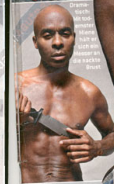
Dramatisch: Mit todernster Miene hält er sich ein Messer an die nackte Brust